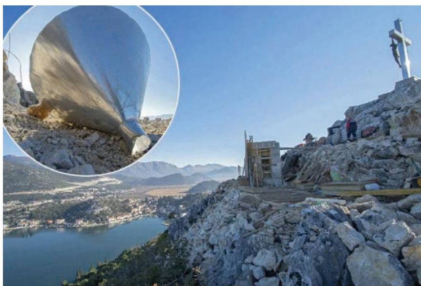
Vjetroorgulje na brdu Trovro

Tehnika izrade orgulja iznimno je zahtjevna. U proizvodnji se prvo izrežu svi dijelovi tube, redukcija, cijev, rezonator i poklopac rezonatora prema dimenzijama svake svirale, a onda se na hidrauličnoj savijačici lim savija pod pravim kutom ili, kao kod redukcije, pod određenim kutom. Kada su svi sastavni dijelovi pripremljeni, počinje zavarivanje. Prirubnice se tokare i zavaruju na rezonatore i usisne dijelove. Tonalitet zvuka ovisit će o dužini re-